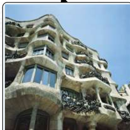
Casa Milà, 1905, Barcellona