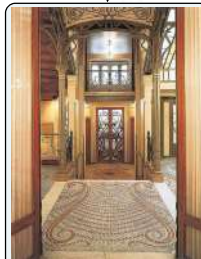
Hotel Tassel, 1893, Bruxelles