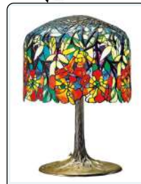
Tiffany, lampada, 1899