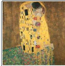
Il bacio, 1907