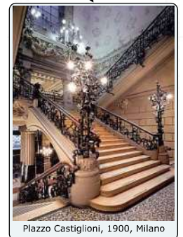
Piazza Castiglioni, 1900, Milano