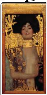
Giuditta I, 1901