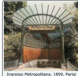
Ingresso Metropolitana, 1899, Parigi