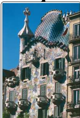
Casa Batlló, 1904, Barcellona