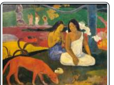
P. Gauguin, Felicità, 1892