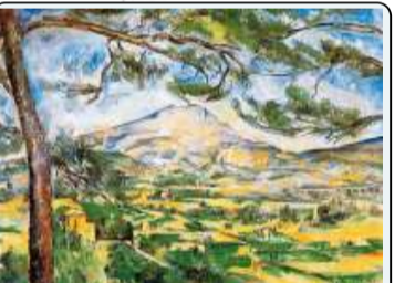
P. Cezanne, Monte Sainte Victoire, 1887