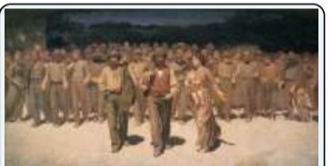
G. Pellizza da Volpedo, Il quarto stato, 1901