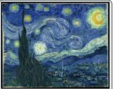
V. Van Gogh, Notte stellata, 1889