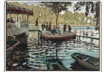
C. Monet, Le Grenouillere, 1873