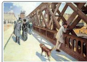
G. Caillebotte, Il ponte dell'Europa, 1876

Gustave CAILLEBOTTE Camille PISSARO Alfred SYSLEY