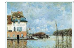
A. Sisley, Inondazione a Port Marly, 1876