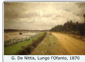
G. De Nittis, Lungo l'Ofanto, 1870