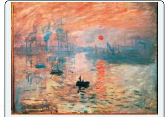
C. Monet, Impressione levar del sole, 1872

CON TERMINE USATO INIZIALMENTE IN SENSO DISPREGIATIVO PER CRITICARE UN'OPERA CHE SEMBRAVA INCOMPLETA CHE DAVA SOLO L'IMPRESSIONE DELLA COSA RAPPRESENTATA