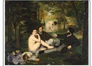
E. Manet, Colazione sull'erba, 1863, Parigi