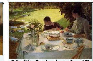
G. De Nittis, Colazione in giardino, 1883

Gustave CAILLEBOTTE Camille PISSARO Alfred SYSLEY