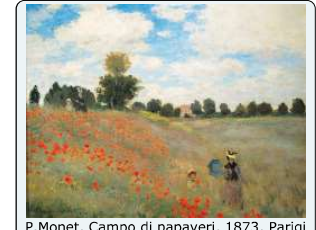
P. Monet, Campo di papaveri, 1873, Parigi