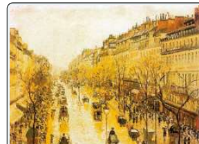
C. Pissaro, Boulevard Montmartre, 1897