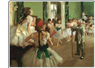
E. Degas, Scuola di danza, 1874, Parigi