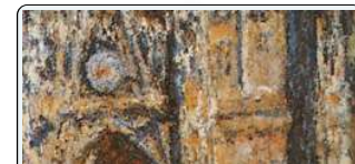
PARTICOLARE Monet, Cattedrale di Rouen, 1894