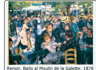
Renoir, Ballo al Moulin de la Galette, 1876